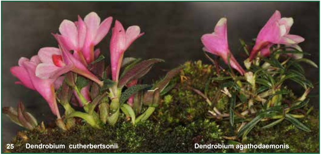
25 Dendrobium cuthbertsonii