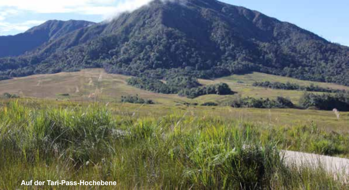
Auf der Tari-Pass-Hochebene