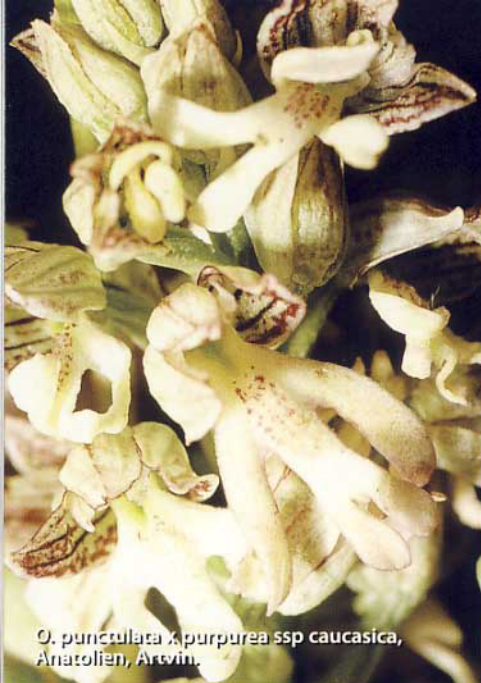
O. punctulata x purpurea ssp caucasica , Anatolien, Artvin.