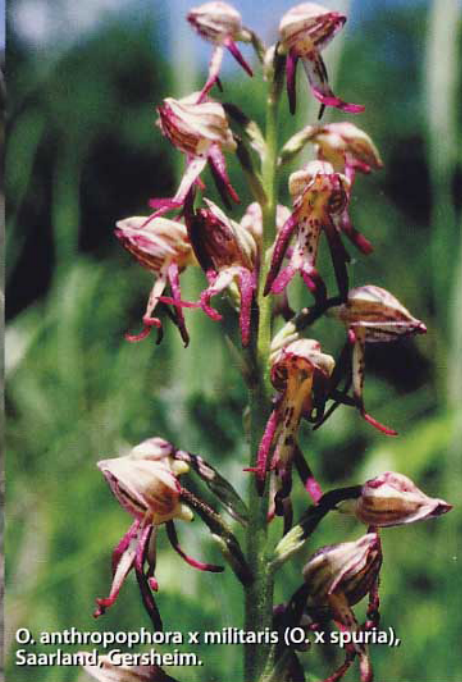
O. anthropophora x militaris ( O. x spuria ), Saarland, Gersheim.

Viele aufschlussreiche Folgerungen lassen sich durch diese Neuaufteilung erkennen. So ist die Flut an intergenerischen Hybriden zu einem logischen Minimum geschrumpft. Die monotypische Gattung Aceras ist in Orchis aufgegangen, was alleine zu einem Wegfall von 6 Gattungshybriden führte.