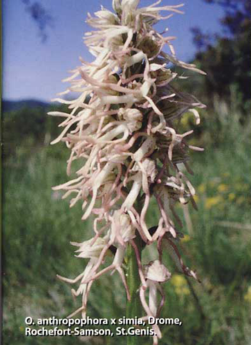
O. anthropophora x simia , Drome, Rochefort-Samson, St.Genis.