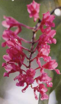
Eine schöne rosablühende Rodriguezia .