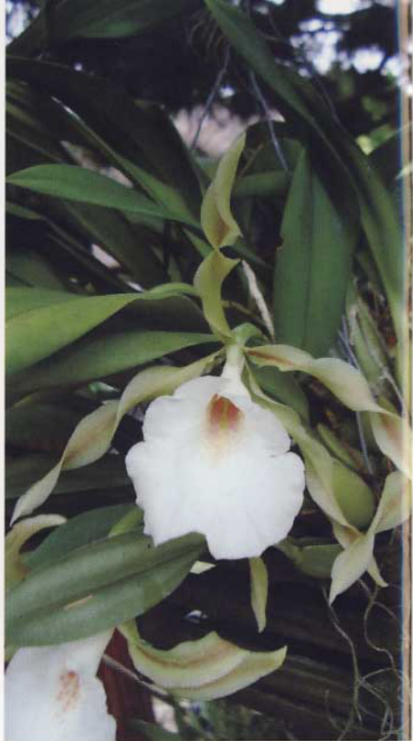
T. tortilis aus WARNER, Robert; WILLIAMS, B.S. The Orchid Album , 1889.

Leider bekommt man die Pflanzen selten zu sehen, was verwundert, da gerade diese Art im Vergleich zu anderen Vertreterinnen der Gattung nicht schwer zu kultivieren ist. Grundsätzlich wird in der Literatur der temperierte Bereich als der Art zuträglich beschrieben. Auch wird immer wieder eine Kultur im Cattleyen-Klima empfohlen. Ich selbst pflege meine Pflanzen seit Jahren im Zimmer und im Sommer im Freien in einem Baum gehängt. Das Ergebnis können Sie auf den Bildern sehen; vielleicht ermutigen sie ja den Einen oder die Andere sich nach einer Pflanze dieser äußerst lohnenswerten Art umzusehen. Sie werden jetzt wieder hier und da angeboten! ○