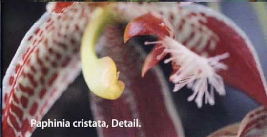
Paphinia cristata , Detail.