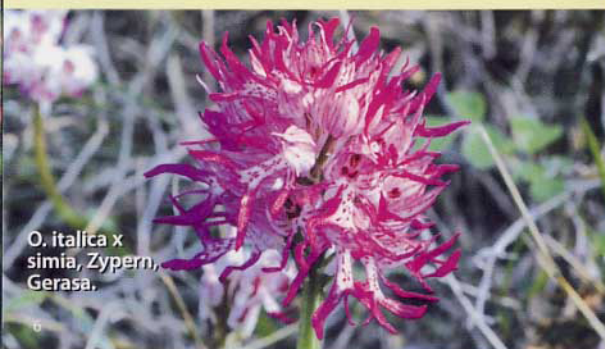
O. italica x simia, Zypern, Gerasa.