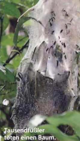
Tausendfüßler töten einen Baum.