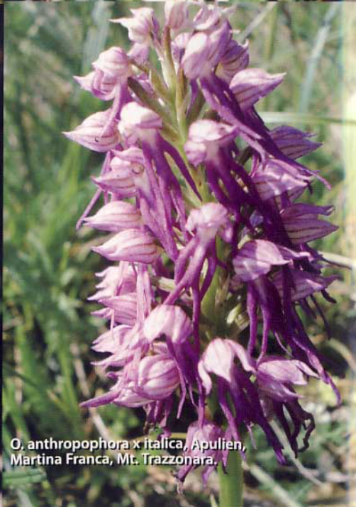
O. anthropophora x italica , Apulien, Martina Franca, Mt. Trazzonara.