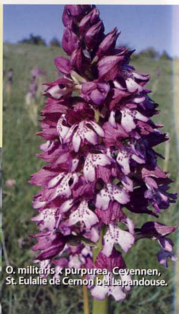
O. militaris x purpurea, Ceyennen, St. Eulalie de Cernon bei Lapandouse.