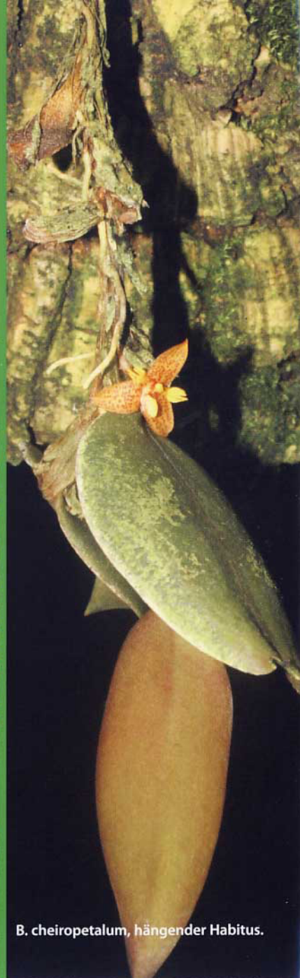
B. cheiropetalum , hängender Habitus.