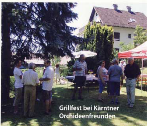
Grillfest bei Kärntner Orchideenfreunden

Wassergasse 12 3443 Sieghartskirchen Tel.: 02274/2269 Fax: 02274/2269 4 Besuch bitte nach telefonischer Voranmeldung