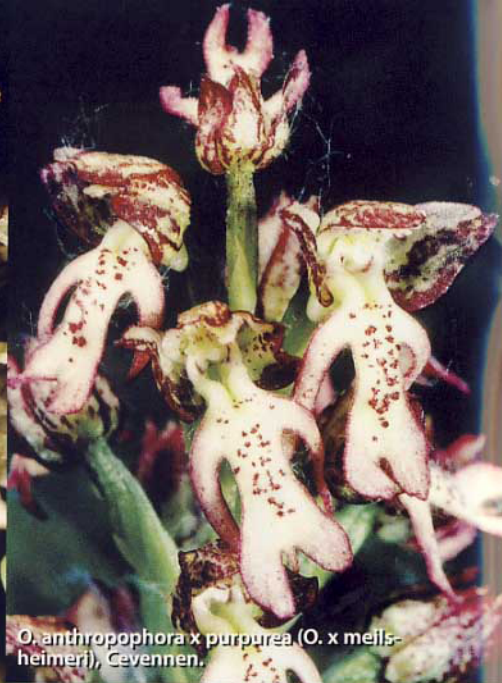
O. anthropophora x purpurea ( O. x mellshheimeri ), Cevennen.