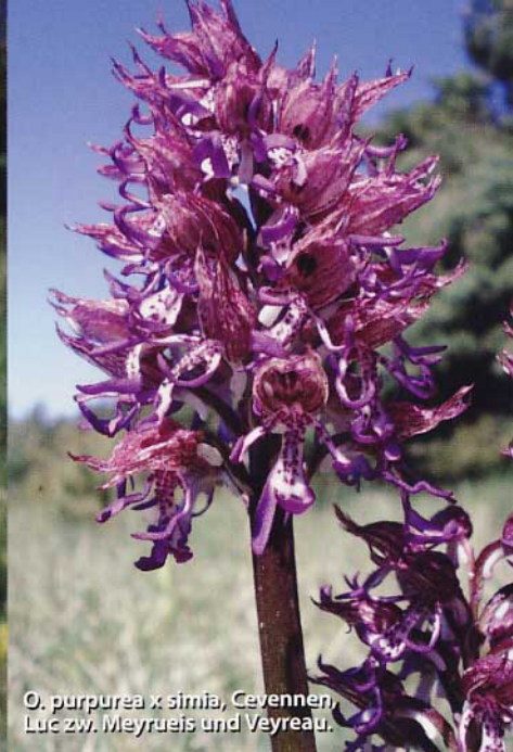
O. purpurea x simia , Cevennen, Luc zw. Meyrueis und Veyreau.