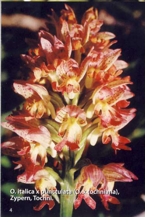
O. italica x punctulata ( O. x tochniana ), Zypern, Tochni.