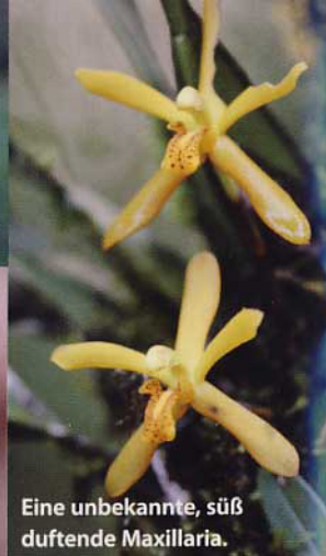
Eine unbekannte, süß duftende Maxillaria .