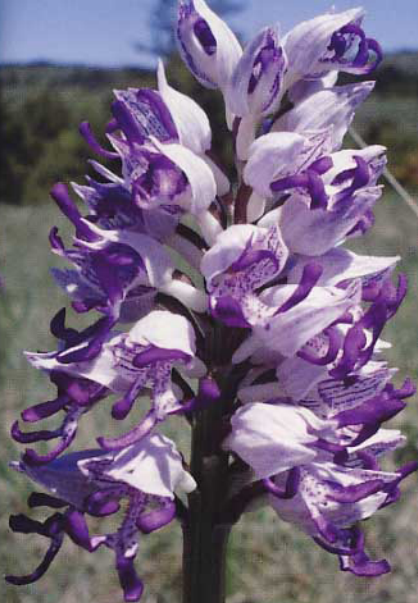
O. militaris x simia , Cevennen, Les Mazes zw. Meyreuis und Veyreau.