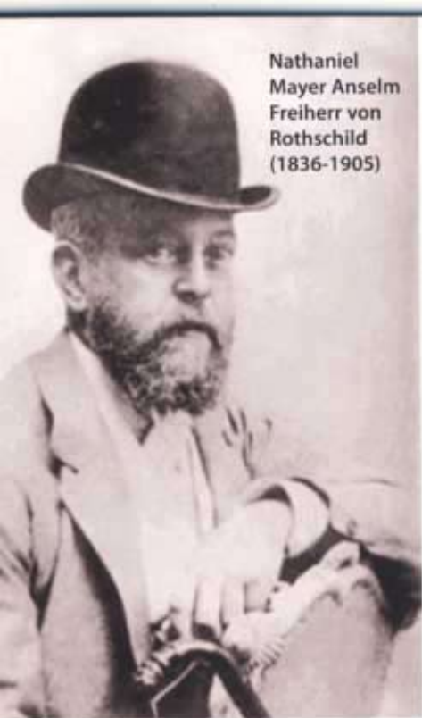
Nathaniel Mayer Anselm Freiherr von Rothschild (1836-1905)