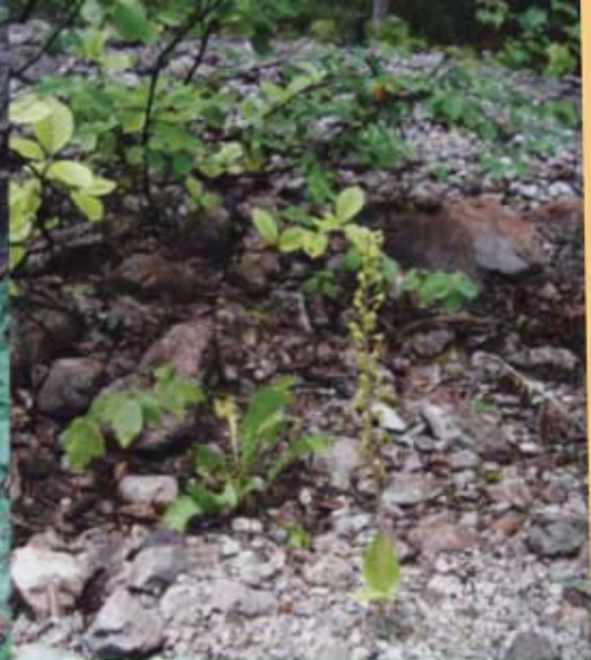
ungewöhnlicher Standort auf einer Schotterbank in Salzburg

Fruchtkapseln finden. Die Einzelblüten selbst sind zwar wegen ihrer grünen Farbe nicht besonders spektakulär, jedoch bei näherer Betrachtung eindeutig als Orchideenblüten zu erkennen. Sie sind etwa eineinhalb Zentimeter groß, bei genauerem Hinsehen fallen die helmartig zusammenneigenden Tepalen auf. Die Sepalen sind rundlich-oval, die Petalen eher länglich-oval und etwa gleich lang. Sie sind grün, manchmal auch bräunlich getönt oder gerandet.