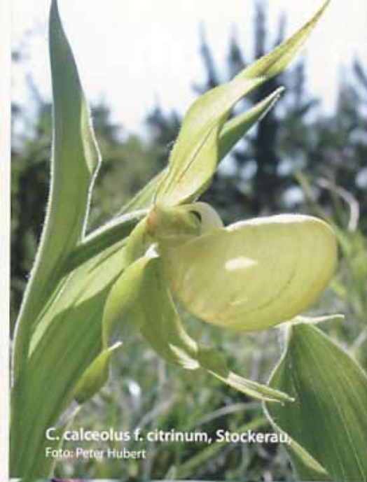
C. calceolus f. citrinum , Stockerau