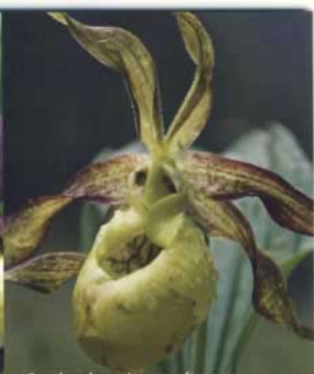
C. calceolus mit gespaltenem Blütenblatt