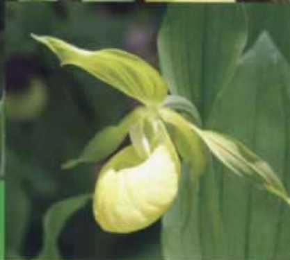
C. calceolus , vierblütig, Bayern, Sulzbach-Rosenberg