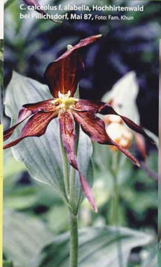
C. calceolus f. alabella , Hochhirtenwald bei Pillichsdorf, Mai 87, Foto: Farn. Khun