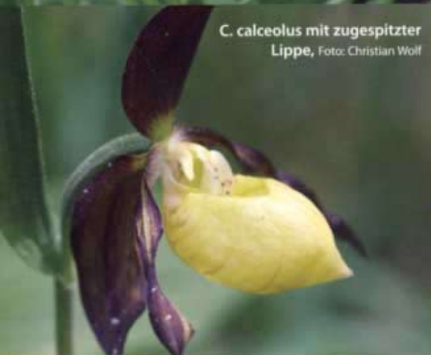
C. calceolus mit zugespitzter Lippe