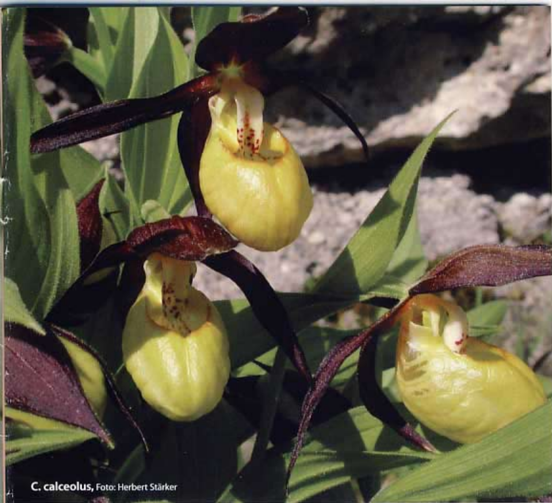
C. calceolus , Foto: Herbert Stärker

graben. Im niederösterreichischen Krems machte es sich ein Polizist und Naturliebhaber mit Erfolg zur Aufgabe, die Frauenschuh-Nachstellungen im Nussdorfer Gebiet aufzuklären.