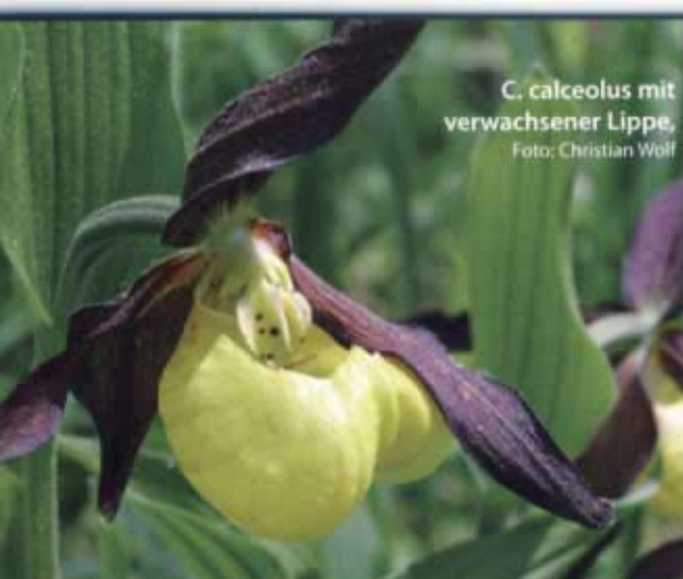
C. calceolus mit verwachsener Lippe, Foto: Christian Wolf