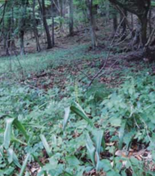
Bestand im nordseitigen Laubwald im Wienerwald