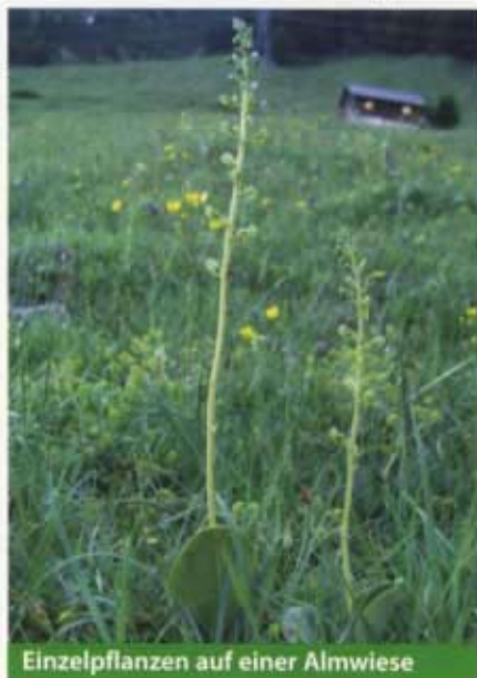
Einzelpflanzen auf einer Almwiese

eine Menge drahtiger Wurzeln in das umgebende Erdreich vorarbeiten um notwendiges Wasser und Nährstoffe herbeizuschaffen. Im erwachsenen Zustand ist sie von ihrer Mykorrhiza unabhängig und kann angeblich über 20 Jahre immer wieder blühen.