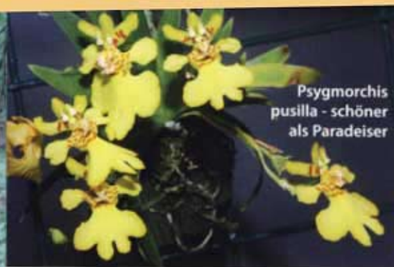
Psygmorchis pusilla - schöner als Paradeiser

strahlt. Das Wichtigste an einer Vitrinenkultur ist ja die ausreichende Belüftung und Luftbewegung. In dem Fall ist das so gelöst, dass auf dem Boden der Konstruktion ein Ventilator liegt, der sowohl die Luft im Inneren durchwirbelt als auch durch die unten offene Konstruktion der Kunststoffhaube dauernd Frischluft mit ansaugt. Am anderen, oberen Ende des Luftstroms befindet sich noch der verlängerte Auslass einer Nebelanlage, die automatisch gesteuert für ausreichende Luftfeuchtigkeit für die Orchideen sorgt – 80% tagsüber und 50% relative Luftfeuchtigkeit in der Nacht.