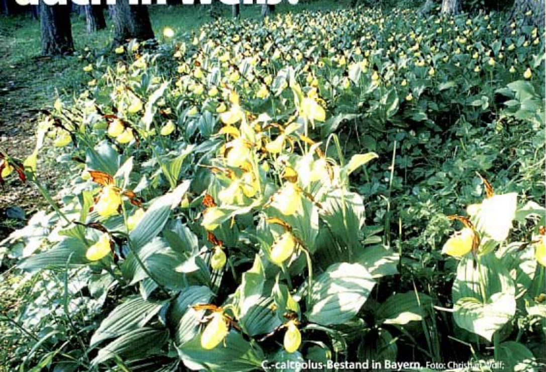
C.-calceolus-Bestand in Bayern.

NORBERT GRIEBL zeigt die Formenvielfalt unseres heimischen Frauenschuhs Cypripedium calceolus .