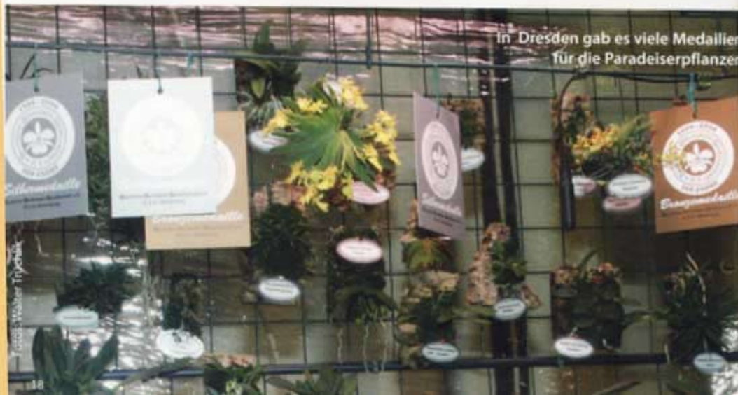
In Dresden gab es viele Medaillen für die Paradeiserpflanzen