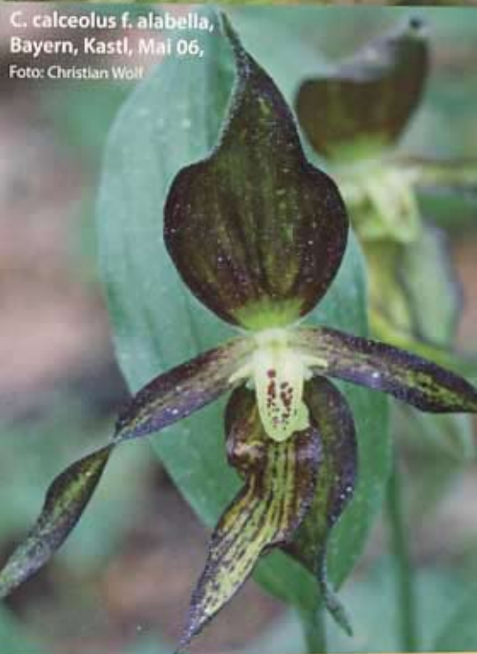
C. calceolus f. alabella , Bayern, Kastl, Mai 06, Foto: Christian Wolf