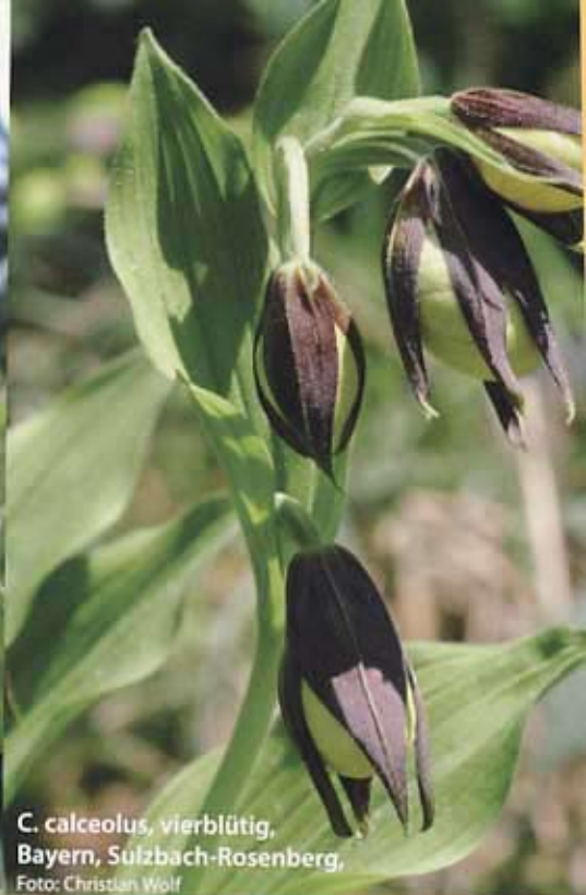
C. calceolus , vierblütig, Bayern, Sulzbach-Rosenberg, Foto: Christian Wolf