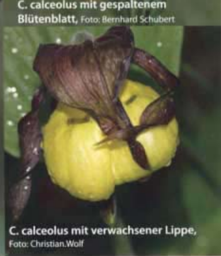
C. calceolus mit verwachsener Lippe

Artnamen calceolus nimmt auf die Lippenform Bezug. Er ist lateinisch und bedeutet „kleiner Schuh“.